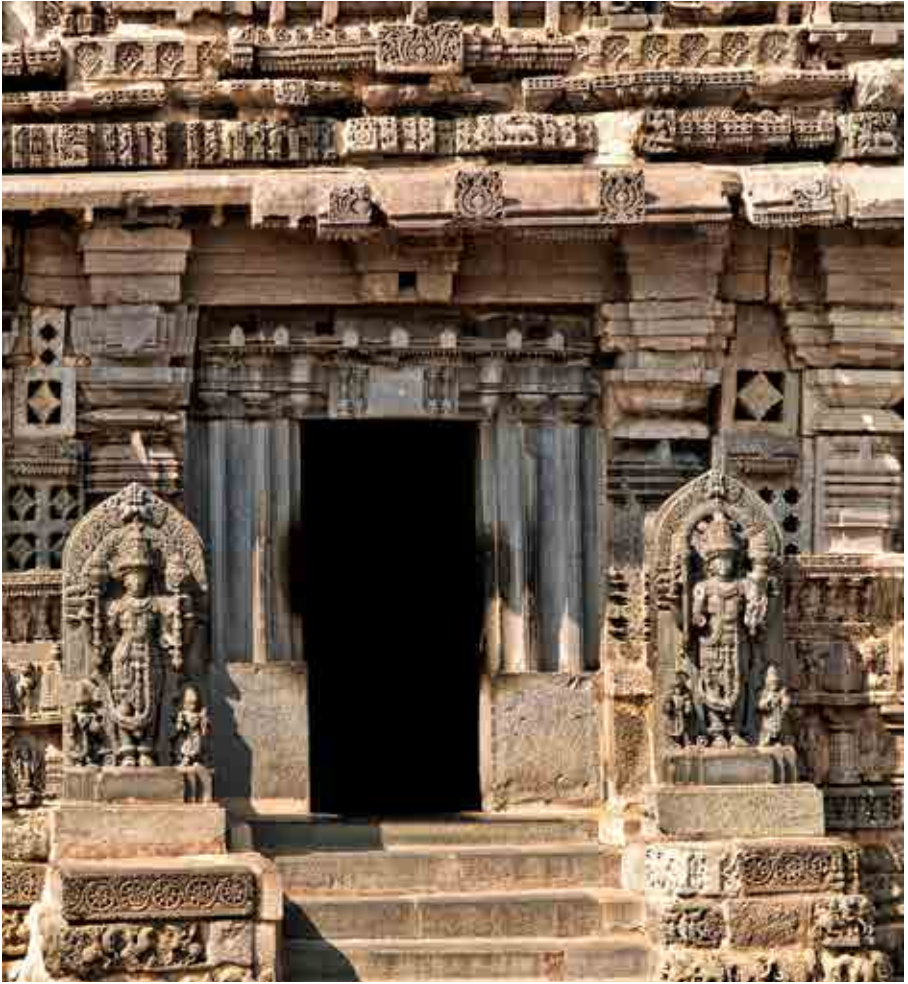
Escalier d'entrée du temple de Keshava de Somnâthpur, encadré par deux stèles de Vishnou. Stairs at the entrance of the Keshava Temple in Somnathpur, flanked by two steles of Vishnu.