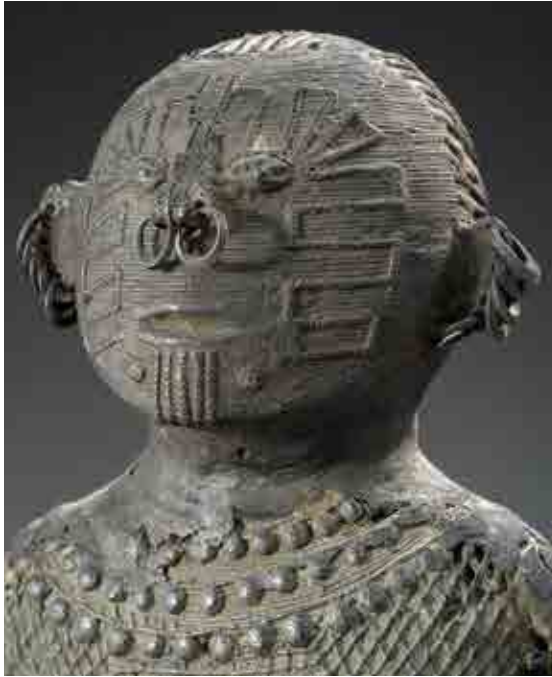
11 - Small figure representing a goddess, Kutia Kondh, Orissa, India 19 th century, bronze, height 36.5 cm Provenance: old Italian collection (Reference number under the left foot: GLB 100/1/1992)

The Kondh are the largest tribe of Central India. The tribe is divided in several subgroups. Until the mid-20 th century, these primitive groups living in remote areas were almost unknown from the rest of India, British colonizers and travellers.