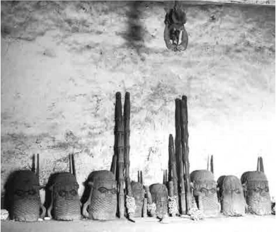
Autel de chef arhu erha . Photographie de William B. Fagg, 1958.

© The Royal Anthropological Institute of Great Britain and Ireland, Londres, William B. Fagg Archive, 1958-52-4.