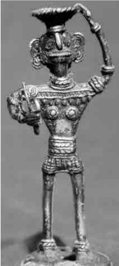
Statuette récente de la déesse Khanda Kankalini, armée de son sabre et portant son vase sur la tête, dont le culte est toujours vivace au Bastar, œuvre d'un fondeur Ghadwa.

Indian tribal art has not yet received its due, and studies are scarce. In spite of our efforts we have not to this day found anything approaching this mysterious sculpture which seems to belong to a unique style.