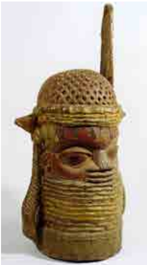
Right. Commemorative head of a King – uhunmwun-elao , Kingdom of Benin, Nigeria, 18 th /19 th century, ivory, height: 23.5 cm. Coll. W.D. Webster, inv.III C17109 Berlin, Staatliche Museen zu Berlin-Ethnologisches Museum © Ibidem (photo M.Franken).