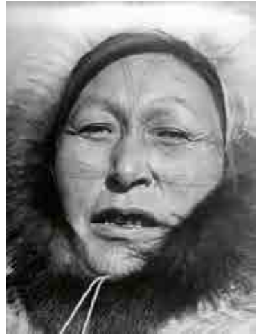
Gauche . Tête humaine Okvik, détroit de Béring, Alaska. Ivoire de morse. Hauteur : 7 cm. Collection Francesco Pellizzi. Centre. Tête humaine, Okvik, détroit de Béring, Alaska. Ivoire de morse. Hauteur : 4,5 cm. Princeton University Art Museum, the Lloyd E. Cotsen, Class of 1950, Eskimo Bone and Ivory Carving Collection (1997-130) © Ibidem. Droite. Portrait d'une femme eskimo imooyok au visage tatoué. Photographie : Margaret Bourke-White, octobre 1937.