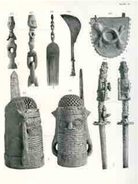
Notice détaillée et deux photos de face et de profil, pp. 72, 73, pl. 36, figs. 277, 278. Pitt-Rivers Augustus Lane Fox. Antique Works of Art from Benin . London: Harrison & Sons, 1900.