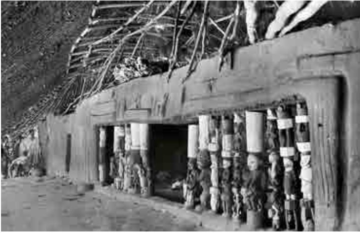
Photographie de Léo Frobenius, 1910, Agbeni Sango, lieu saint à Ibadan. Les poteaux des vérandas forment un écran devant l'autel. Probablement les premiers visuels qui existent du lieu. Noter le rôle effectif de piliers des statues-poteaux supportant la poutre maîtresse masquée par le revêtement en torchis © Frobenius Institute, Frankfurt.