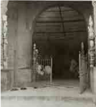
Photograph by Leo Frobenius, 1910. Agbeni Sango, a holy place at Ibadan. The veranda posts serve as a screen before the altar. These are probably the earliest visual records of the place. The post-statues are actually pillars supporting the main beam which is concealed by a cob coating © Frobenius Institute, Frankfurt.