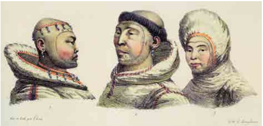
Habitants de St. Lawrence Island aux visages tatoués. Dessin de Ludwing Choris, 1822.