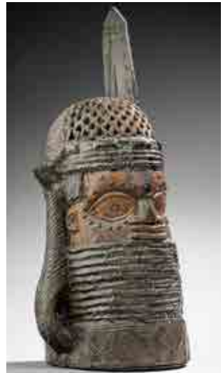
Gauche. Tête de l'ancienne collection Baessler, hauteur 57,5 cm © Ibidem (photo E. Winkler).